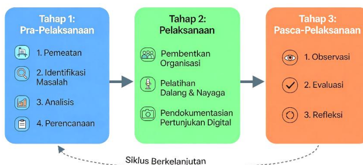
Gambar 1. Tahapan kegiatan pengabdian melalui metode PAR

Pelaksanaan pengabdian yang memberdayakan para pemuda ini menggunakan pendekatan Participatory Action Research (PAR). Pendekatan ini melibatkan partisipasi aktif masyarakat dalam setiap tahapan kegiatan pengabdian. Pendekatan ini dilaksanakan tujuh langkah yaitu pemetaan awal, pengidentifikasian masalah, analisis masalah, perumusan rencana tindakan, pelaksanaan aksi, pengamatan dan evaluasi, dan refleksi. Ketujuh langkah tersebut dibagi menjadi tiga tahapan, yaitu pra-implementasi, implementasi, dan pascapelaksanaan.