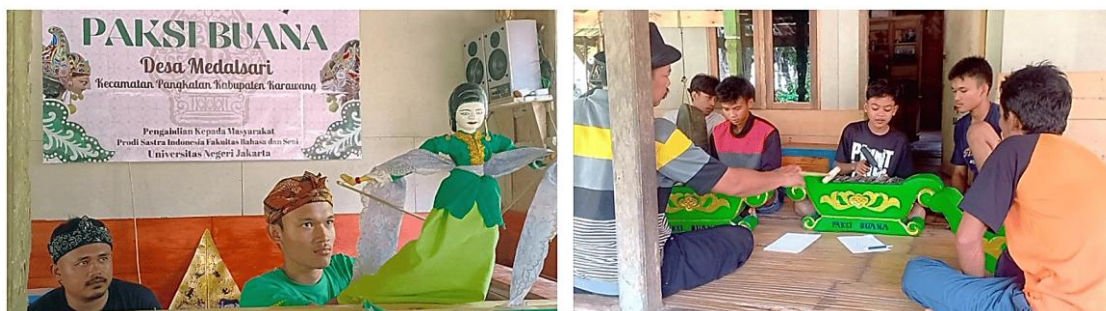
Gambar 3. Pelatihan dalang dan nayaga bersama seniman senior

peserta dapat menekuni bidang yang sesuai dengan potensi mereka.