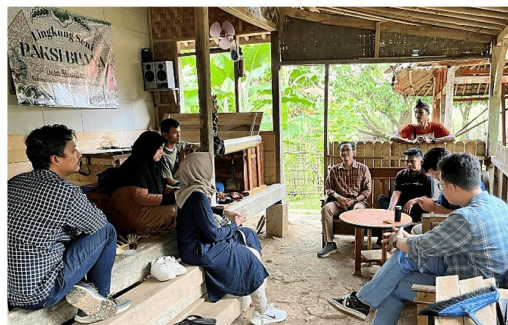
Gambar 2. Wawancara dengan pemerintah desa dan kelompok seni Paksi Buana